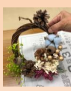
クリスマスリースづくり

2021年度、蔵王公民館の社会教育活動事業では、コロナ禍においても生涯学習講座を通じて、健康寿命の延伸と地域活動への参加推進を目的として、一般成人向けの講座を6回開催しました。