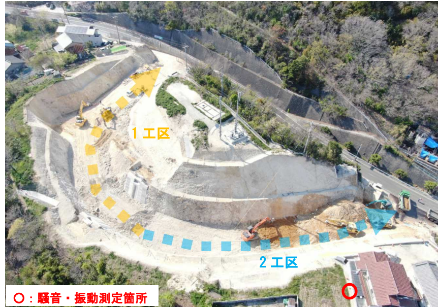
3月の騒音・振動測定結果

今後は、ブロック積擁壁をはじめとした構造物工事を実施してまいります。引き続き、周辺環境への配慮を行い、安全な工事に努めます。