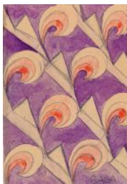
ジャコモ・パガニニ《速度の線・空間》

様式や作家、時代、地域を超えて、「反復(繰り返し)」は、美術史上の重要なキーワードの一つになっています。本展では、さまざまな作家の「反復(繰り返し)」が用いられた作品を展覧しつつ、そこに込められた意味を考えます。