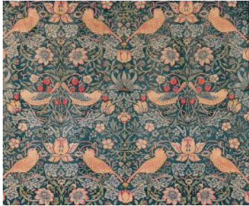
ウィリアム・モリス《いちご泥棒》1883年

アーツ・アンド・クラフツは、産業化が進む19世紀後半のイギリスで興ったデザイン運動です。この運動を先導したウィリアム・モリスは、ハンド・メイドによる質が高く、実用的な美術工芸品を生産し、生活に人間らしい温かみを取り戻そうとしました。本展では、モリスによる多様なジャンルでの実践から英国での展開、独自の発展を遂げたアメリカへの影響まで、壁紙や織物、家具、金工、ステンドグラスなど約170点の多彩な作品により、日常品の有用性と美しさの両立を目指したこの運動の広がりを紹介します。