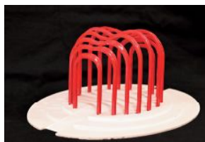
高橋秀《愛のアーチのマーケット》1988年

福山には、数多くの屋外モニュメントが存在します。それらが、どんな芸術家によって制作されたかご存知ですか。本展では、ふくやま美術館の所蔵品を通して、普段見慣れた屋外作品とその作家を見つめ直します。