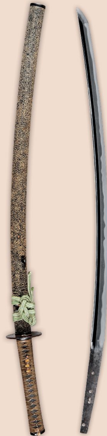
国宝《太刀 銘筑州住左(号江雪左文字)》南北朝時代(14世紀) ふくやま美術館蔵(小松安弘コレクション)