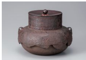
西村九兵衛《甕口尾垂松梅地紋釜》

音や声、あるいは質感や様子をあらわす際に使う言葉、「オノマトペ」(擬音語、擬態語)。本展では、日本語の豊かなオノマトペを手がかりに、見る人の聴覚や触覚を刺激するさまざまな作品を紹介します。