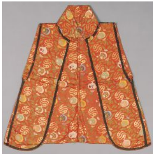
和歌山県指定文化財 徳川頼宣所用 《紅地桃文様糸入織珍羽織》 江戸時代(17世紀) 紀州東照宮蔵

ふくやま美術館が所蔵する「江雪左文字」は、南北朝時代に筑前国の刀工である左文字によって作られた太刀です。北条氏の武将、板部岡江雪斎がかつて所有し、徳川家康に献上されたのち、十男で紀伊藩初代藩主となった徳川頼宣へ譲られました。そして現在はこの福山の地に伝えられています。「江雪左文字」の伝来経緯は、一口の太刀が天下の名刀となっていく過程を如実に示すものです。本展では、かつての持ち主たちが愛した品々とともに「江雪左文字」を展覧し、この太刀に秘められた物語を紐解きます。