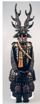
国重要文化財 本多忠勝所用 《黒糸威胴丸具足(鹿角脇立兜・小具足付)》 桃山時代(16世紀) 個人蔵(岡崎市美術館博物館寄託)

2022(令和4)年は福山城築城400年の年です。これを記念した福山城博物館の展覧会について、福山城博物館を第1会場、ふくやま美術館を第2会場として同時に開催します。美術館では福山藩初代藩主水野勝成と、徳川家重鎮である酒井・本多・榊原・井伊の、徳川四天王に関する武器・武具を中心に展示します。それらは藩祖にまつわる、各家の歴史を表すものとして、大切に保管され、後世に受け継がれてきました。武家の魂である武器・武具の世界をお楽しみください。