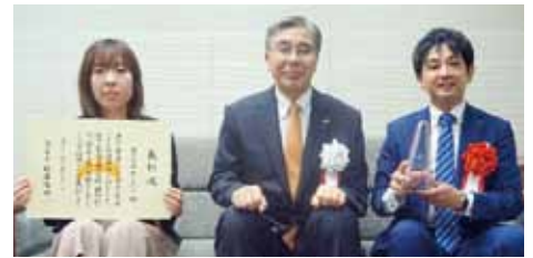
福山市副市長と記念撮影

2017年（平成29年）12月に「テレワーク規程」を制定し、全社員平等に月2回程度在宅勤務をしている。また、子育て中の職員は子どもの急な体調不良等の場合に、その都度テレワークを活用して業務を行っている。