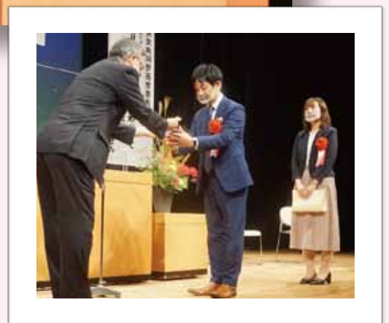
男女共同参画推進表彰の様子