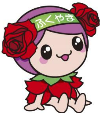
ばらのまち福山 イメージキャラクター「ローラ」