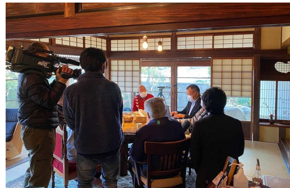
RCCテレビの取材を受ける様子