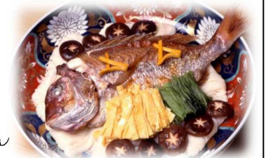
構成文化財：鯛料理