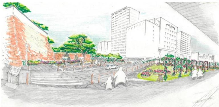
整備イメージパース（福山城口から福山城公園を望む）