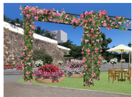
ばらのアーチ・ばら花壇のイメージ