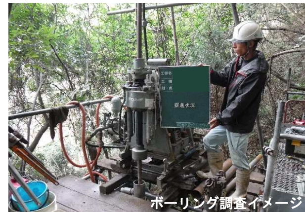
ボーリング調査イメージ

砂防堰堤の詳細な設計をするにあたり、10月初旬から土質調査（ボーリング調査）と測量作業を実施します。また、調査用の機材を搬入するためにモノレールを設置することになりますので、近隣の方にはご迷惑をお掛けしますが、ご理解とご協力をよろしくお願いいたします。