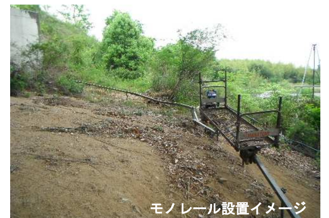
モノレール設置イメージ

調査委託先：(株)荒谷建設コンサルタント 測量担当：木本・畑野 Tel (084)926-1543 地質調査担当：濱田、高本 Tel (082)292-5482