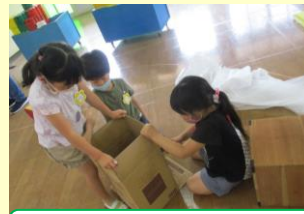
ゲーム屋さんを作ろう