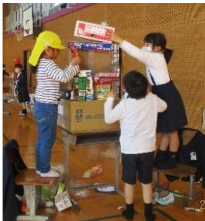
幼保小連携の様子 (5歳児と5年生との交流活動)