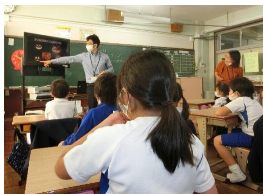
外国語活動の様子