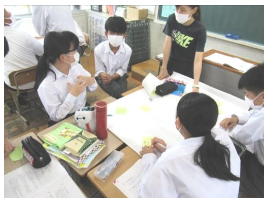
中学校パワーアップ事業の様子

国の「GIGAスクール構想」に基づき、すべての児童生徒に1人1台の端末を整備した。端末は、使用場所を限定せず、文房具のような感覚で自分のものとして使用し、様々な情報や興味のあることに触れ、新たな学びのきっかけにしたり、オンライン教材により、学習速度や習得度等に応じた学習を進めたりできるようにする。端末は、各学校で取り組んでいる、対話的に学ぶことや体験的に学ぶことを組み合わせながら、どのように活かしていくかということが大切で、改めて「子ども主体の学び」の原点に立ち返り、「認知の仕組みから学習方法を見直す」ことに取り組む。