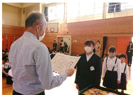
福山学校元気大賞授賞式の様子