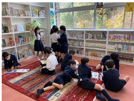
学校図書館の様子

引き続き、各種計画等に基づき、環境整備を着実に進めていく。 2020年度（令和2年度）は、新型コロナウイルス感染拡大防止に伴う一斉臨時休業等により、避難訓練の中止や実施日変更となった学校があったため、各校で感染症対策を工夫して、訓練を実施する。 また、教育上特別な配慮を必要とする子ども一人一人の状況に応じた支援の充実を図る。