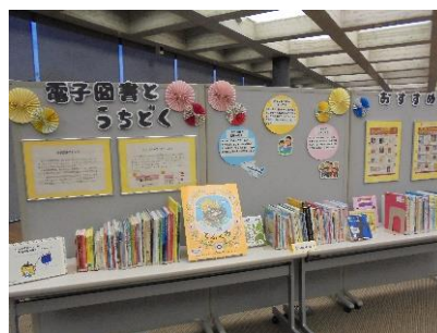
電子図書のPR展示の様子