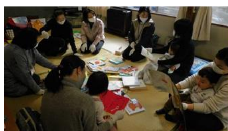
「親プロ」講座実施の様子