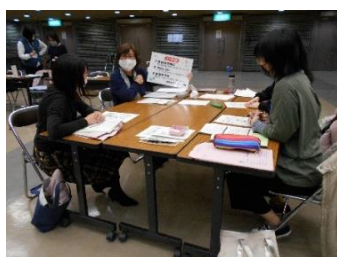
「親プロ」子育てサポーターリーダー養成講座の様子

引き続き、養成講座でボランティアの育成を行う。 新型コロナウイルス対策を行いながら、オンライン等を活用して地域でできる活動方法、団体や組織、住民同士のつながりが促進される仕組みを考えていく。