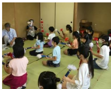
放課後子ども教室の様子（銭太鼓）