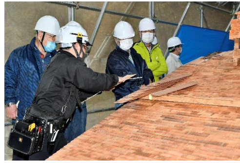
重要文化財沼名前神社能舞台 修理見学会