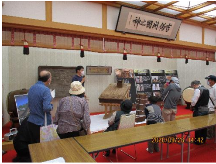
重要文化財吉備津神社本殿 修理見学会