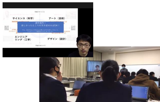
I C T教育機器を活用した授業の様子