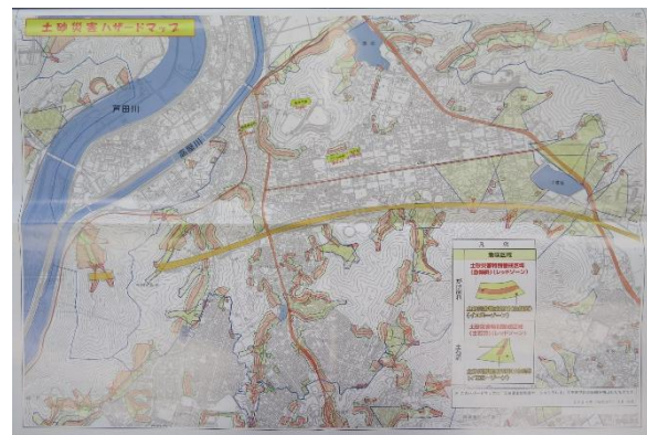
土砂災害ハザードマップ

浸水エリアを海拔で表示 これまでの最高水位(6m) 高屋川がオーバーフローした 時の水位(10m)