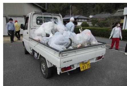
プロジェクトC(清掃活動)のようす 盈進学園・町内会・まちづくり合同