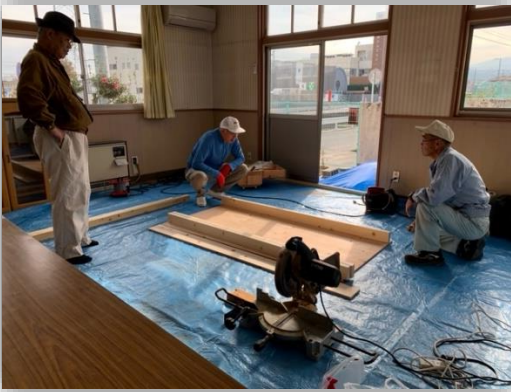
テーブル製作過程

山手学区まちづくり推進委員会の関係者、学区内のボランティアの方、南部生涯学習センター職員、公民館職員で材料購入から製作までを担ってテーブル3台、玄関の段差解消と高齢者も利用出来るように手すりを設置しました。喫茶サロンや団体の利用がガンとアップしています。