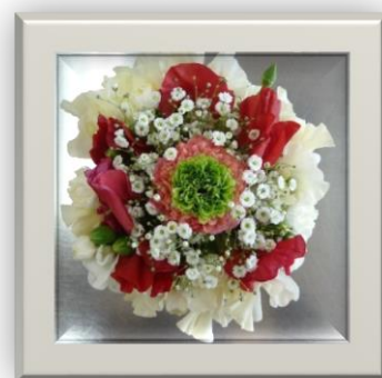
心とむ作品（ケーキバージョン） フラワーアレンジメント