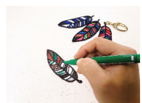
自分色にしてみよう! ぬりえ刺繍ブローチ