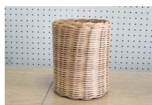
籐手芸でミニバスケット