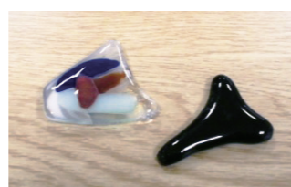
世界に一つだけのアクセサリ【ガラス溶融】