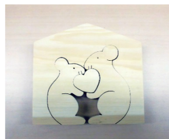
ネズミのカップルとハート【木工】