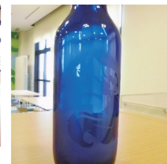
ガラスにアート【サンドブラスト】