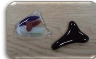
世界に一つだけのアクセサリ【ガラス溶融】