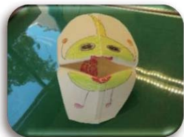
牛乳パックでパクパク人形