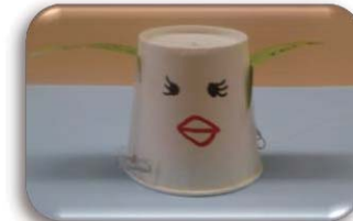
みんなで遊ぼうヨー