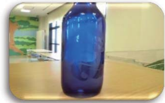
ガラスにアート【サンドブラスト】