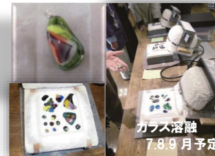
ガラス溶融 7.8.9月予定