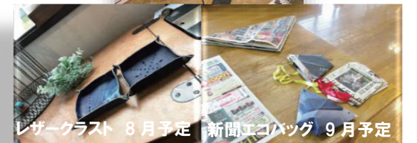
レーザークラフト 8月予定 新聞エコバッグ 9月予定