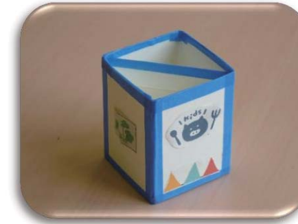
牛乳パックでえんぴつ立て