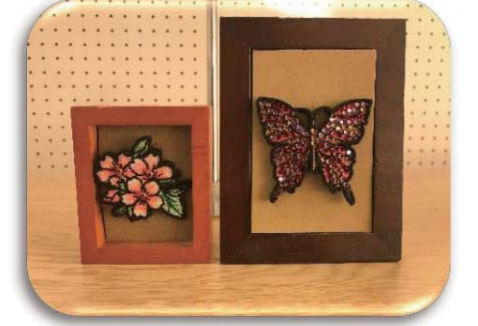
自分色にしてみよう！ぬりえ刺繍ブローチ【刺繍】