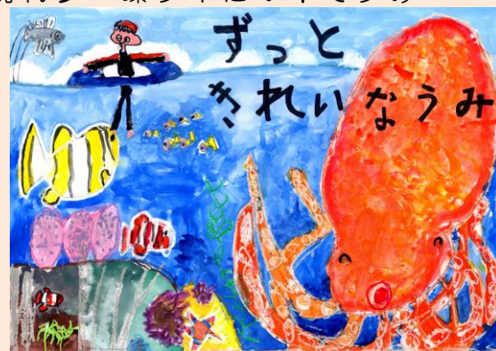
2016年度環境保全ポスター展 最優秀賞作品

2018年5月、タイの海岸に打ち上げられたクジラの胃の中から、プラスチック製の袋約80枚が見つかったニュースが報じられ、世界に大きな衝撃を与えました。こうした出来事は世界各地で頻発しており、口にプラスチックの輪がはまり無残な姿で死んでいるアザラシや、体内に大量のプラスチック片が残った鳥が見つかる等様々です。