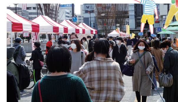
歩道を行きかう人々