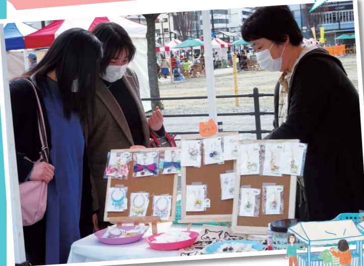
作り手との会話を楽しむ来街者