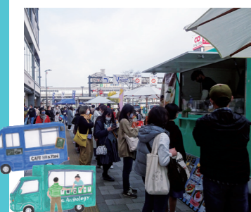
キッチンカーはどこでも大人気