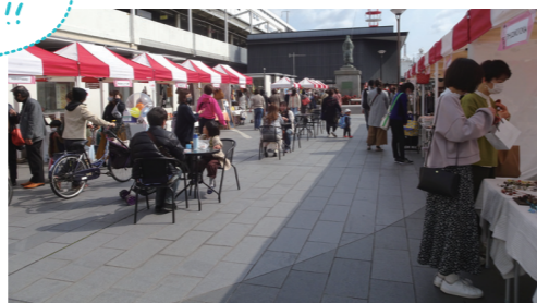
手しごと品が並んだブース