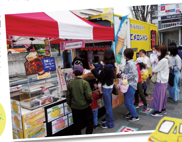
行列ができたキッチンカー