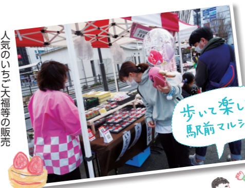
人気のいちご大福等の販売