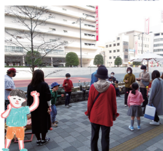
子ども達に人気のけん玉イベント