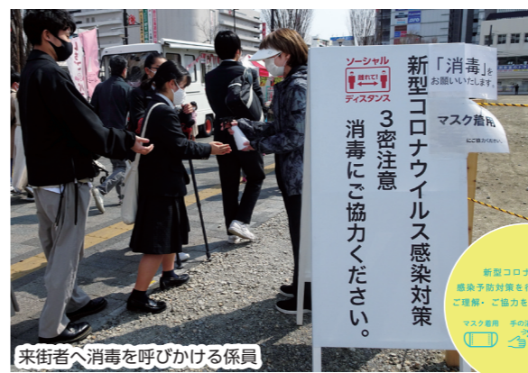
来街者へ消毒を呼びかける係員