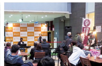
ジャズの音色を聴きながらワインと食を満喫