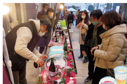
備後ワインなどグラス500円で販売

バラの酵母菌を活用し、せらワイナリーで醸造された赤ワイン「備後ワイン」、福山わいん工房で醸造された「スパークリングワイン」、山野峡大田ワイナリーで醸造された「山野峡ワイン他6種類」の全8種類のワインのショット販売等を行いました。また、ステージ上ではJAZZライブ、アイネス前の歩道空間にはオープンカフェスペースが設置され、ラーメンやピザなどのキッチンカーも並ぶなど、まだまだ肌寒い3月の夜、来場者は心地よいJAZZの音色を聴きながら、美味しいワインと料理を満喫しました。