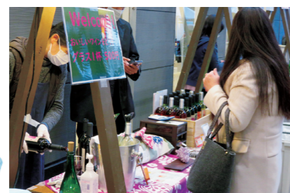
山野峡ワインはいかが? ボトルも販売!