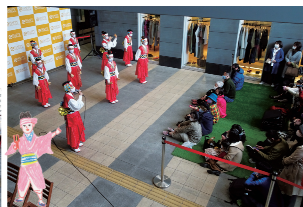
センタープラザで行われたダンスステージ