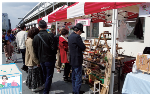
お気に入りを探るお客さん