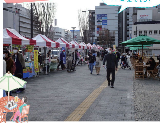
オープンテラスが並ぶマルシェ