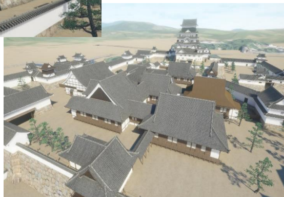
〔VRによる福山城の復元画像〕