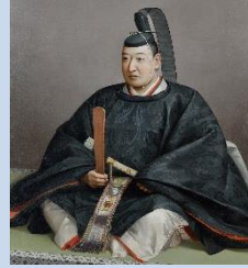
福山藩 阿部家7代藩主 阿部 正弘 (あべまさひろ)

1619年(元和5年)福山に入封した後は福山城の築城とともに海を埋め立てて城下町の建設に邁進することとなる。さらには上水道の敷設や、備後 畳表などの産業の振興, 寺社仏閣の修繕等で活躍し, 福山の礎を築いた。勝成の人生は戦国武将としての前半と, 藩主としての後半に分かれており, 入封後は正に福山開祖と呼べ, 後世に与えた影響は計り知れない。