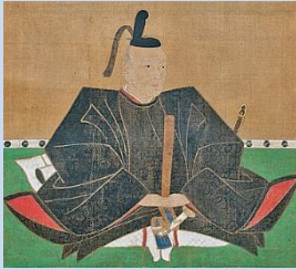
福山藩 水野家初代藩主 水野 勝成 (みずのかつなり)

藩主在任期間 1619年(元和5年)～1639年(寛永16年) 生没年 1564年(永禄7年)～1651年(慶安4年)