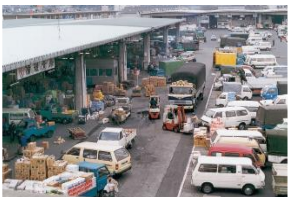
〔福山地方卸売市場〕