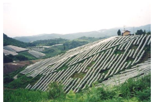
〔急な斜面のぶどう畑〕