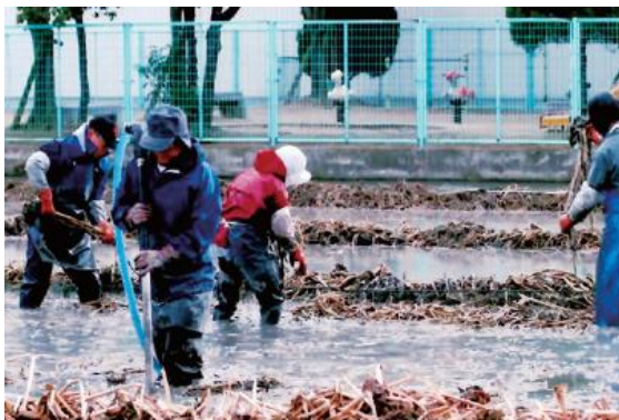
水圧ポンプを使い、水の強い勢いでくわいを掘り出します。