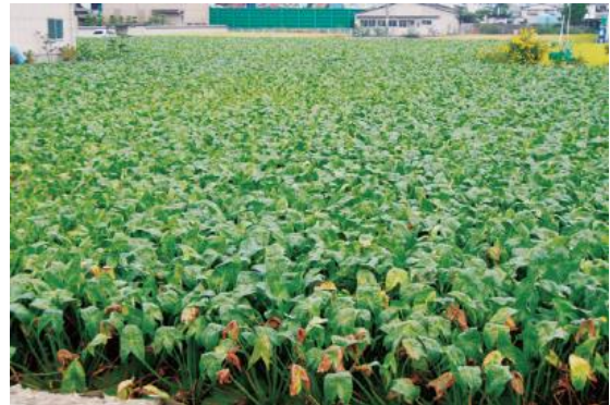
葉が出た後、水の量を増やします。