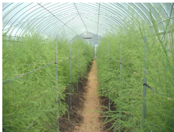
〔アスパラガスのビニールハウス〕