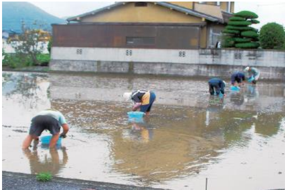
種いもを水田に植え付けます。