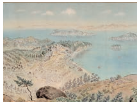
森谷南人子《内海初夏（高島）》1944年

海峡に囲まれ、いくつもの島が浮かび、独自の景観を形作る瀬戸内海。近代画家たちによって描かれた鞆といった名所や瀬戸内の風景を通して、この地の自然と人との営みを探ります。