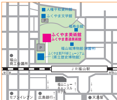
山陽自動車道福山東インターから車で20分

◎ふくやま書道美術館（JR福山駅北口から西へ400m） 〒720-0067 広島県福山市西町二丁目4番3号 TEL 084-925-9222 FAX 084-925-9223 https://www.city.fukuyama.hiroshima.jp/site/fukuyama-syodo/ 駐車場 68台（所蔵品展をご観覧のお客様は1時間無料） 休館日 月曜日（祝休日の場合は開館、その翌日は休館）、年末年始 開館時間 9:30～17:00 観覧料 所蔵品展／一般150円（120円）※（ ）内は有料20名以上の団体料金 ※高校生以下無料