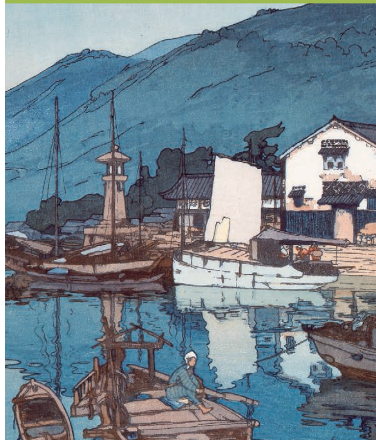
吉田博《郷之港》(部分) 1930年