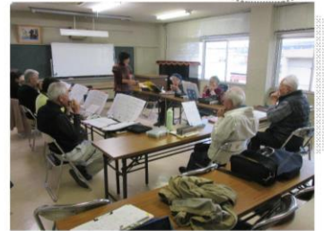
【深津ハーモニカサークル】