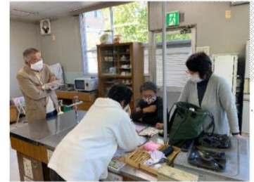
【木版画ローラーの会】