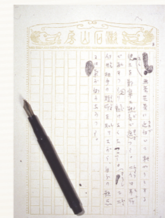
「道草」草稿(日本近代文学館蔵)