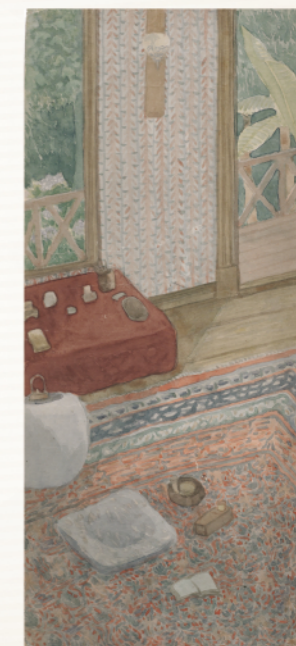
夏目漱石画「書斎図」(県立神奈川近代文学館蔵)