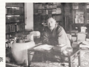
漱石山房の書斎で

国民的作家・夏目漱石と福山との関わりは意外に知られていませんが、漱石の妻・鏡子の里である中根家は代々福山藩士です。鏡子の父・中根重一は貴族院の書記官長を務めた人で、漱石唯一の自伝的小説「道草」では御住の父として描かれています。