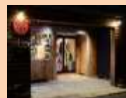
衣料品 サービス店