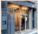
飲食店から 現在は小売り中心に リニューアル