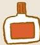
木工用 もしくは布用ボンド