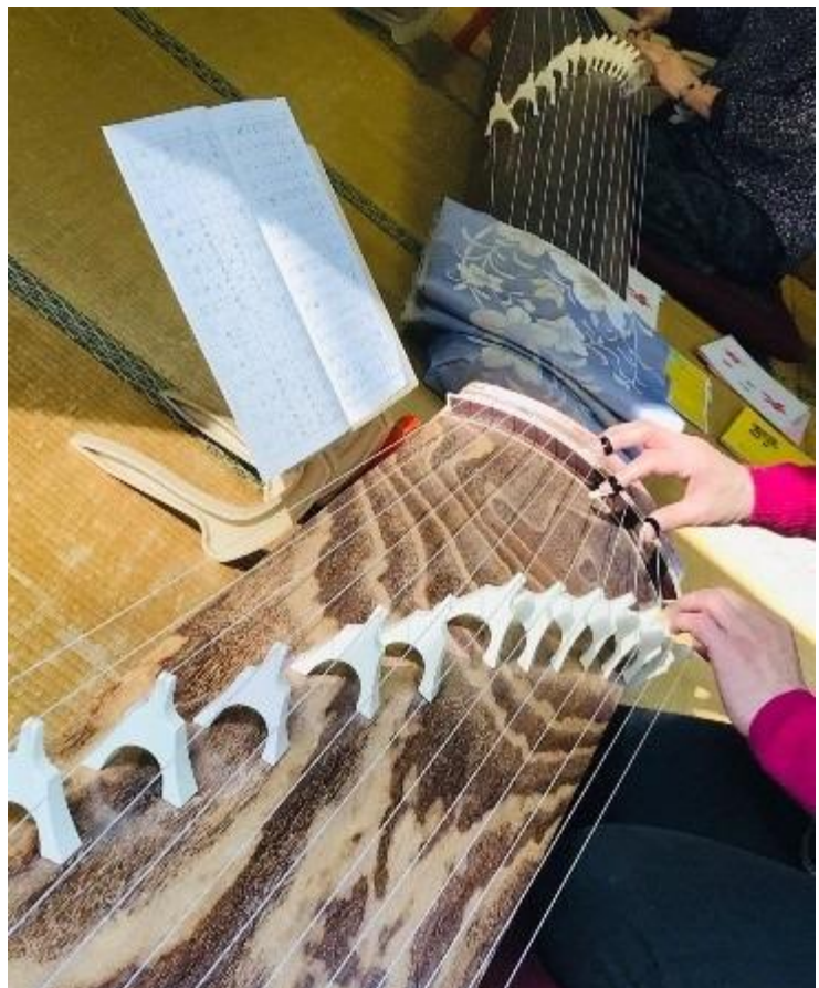
2020年 2月 6日 Facebook 掲載

ふ く や ま ご と でん と う こ う げい み ず の か つ な り ふ く や ま じ やう ち く じ やう ねん し ろ #福山琴 #伝統工芸 #水野勝成 #福山城 #築城400年 #城のあるまち