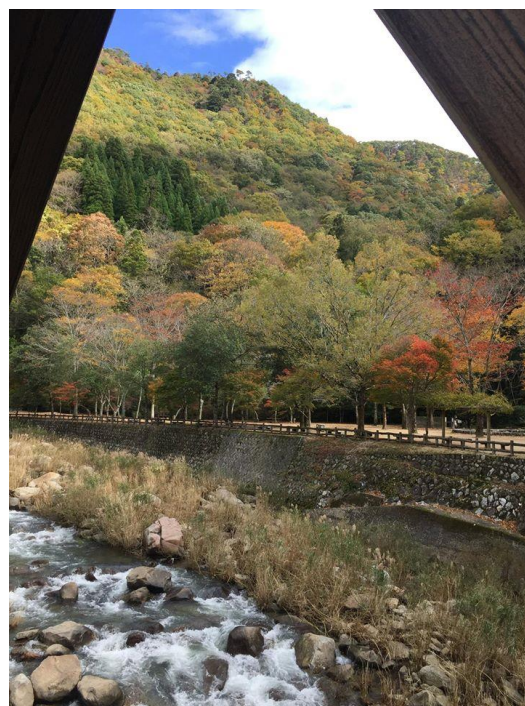
2017年11月 9日 Facebook 掲載