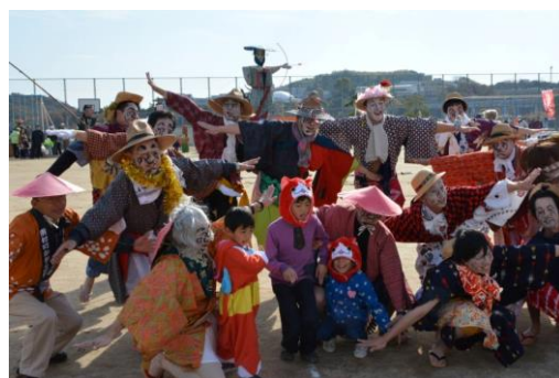
2018年11月15日 Facebook 掲載