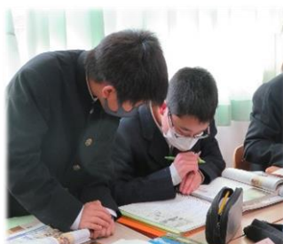
学び合いスタート!