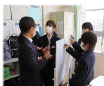
活発なグループ学習