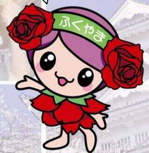
ばらのまち福山 イメージキャラクター「ローラ」

移行に当たっては、届出制度など基本的には広島県条例を引き継ぐこととしておりますが、いろいろと変更点もございますので、ご理解ご協力をお願いいたします。