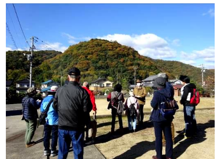
(城山の説明を聞く)