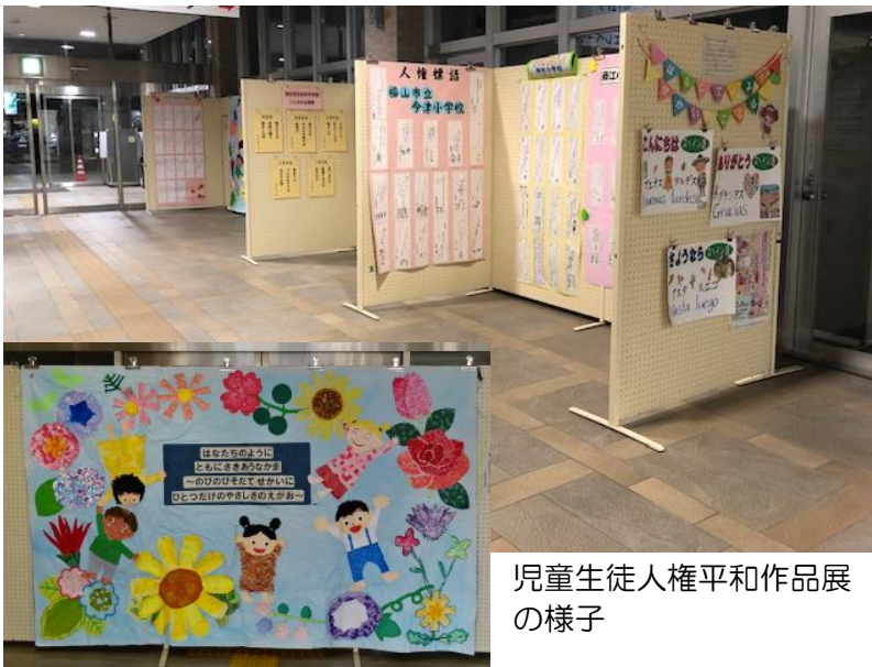
児童生徒人権平和作品展の様子

福山市では、毎年市役所本庁舎や支所ロビーなどで児童生徒人権平和作品展を開催しています。西部市民センターでも12月4日から1階サロンにおいて開催します。