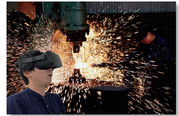
協力:瀬戸内ファクトリービュー実行委員会