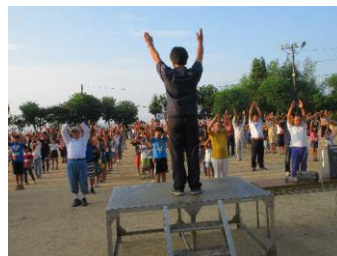
学区一斉ラジオ体操