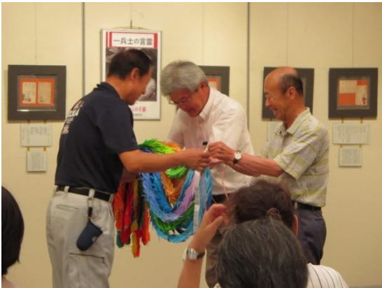
福山市人権平和資料館