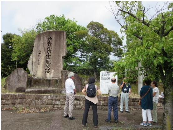
福山陸軍歩兵四十一聯隊(緑町公園)

折り鶴は、山野小中学校の児童生徒・教員、ふれあいサロンやひまわりサロン、おやまのかふえなど高齢者の集いの場で、心を込めて折りました。