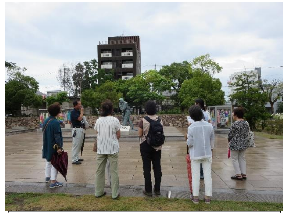
福山市戦災死没者慰霊の像 (母子三人像)