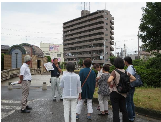
旧福山市体育館東の石橋