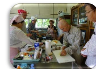
エコクッキング頑張っています