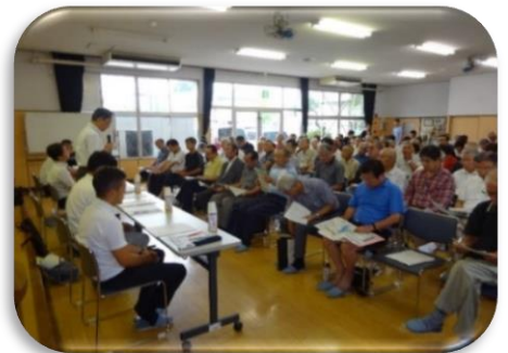
防災をテーマとした意見交換会