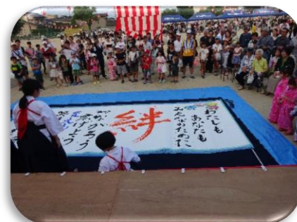
納涼盆踊り大会にて 書道パフォーマンス