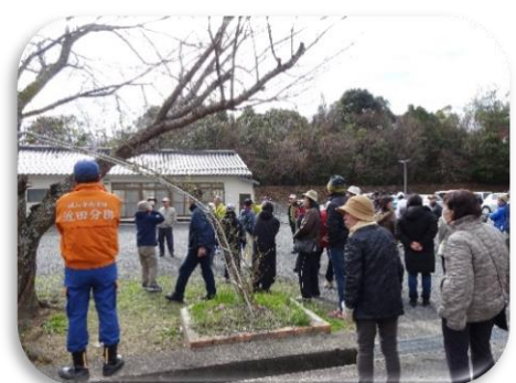
防災さんぽで避難場所を確認