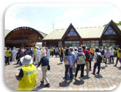
動物園までウォーキング