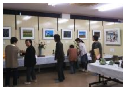
ふれあい文化祭【作品展示会】