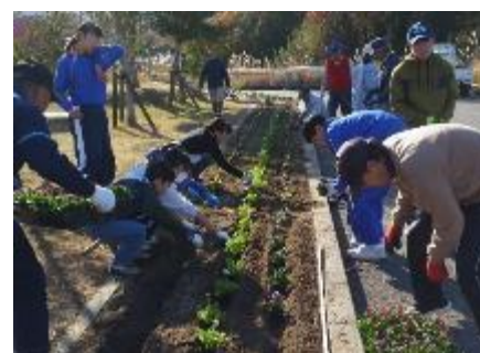
富谷ドームランド花壇