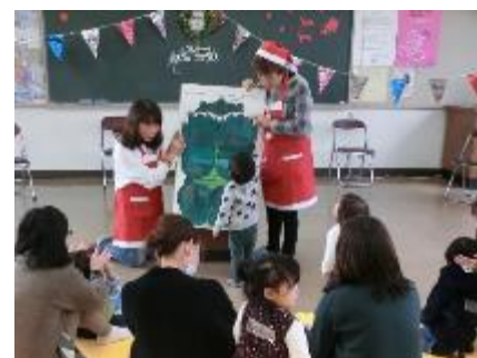
すくすくランド〈クリスマス会〉