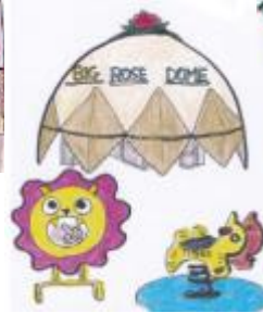
富谷ドームランド