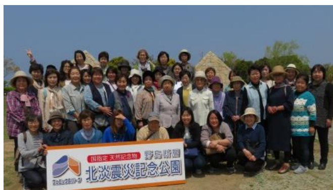
まちづくり研修「阪神・淡路大震災を学ぶ in 北淡町」