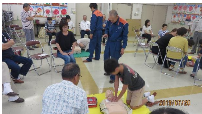
安心・安全を高める事業「普通救命講習会」