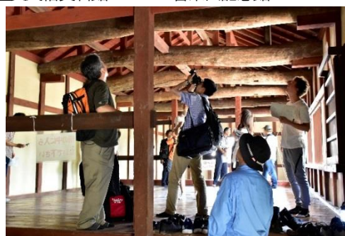
福山城筋鉄御門内部の公開