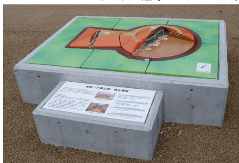
史跡二子塚古墳保存整備工事

【郷土歴史施設】 ・福山城博物館 ・鞆の浦歴史民俗資料館 ・しんいち歴史民俗博物館 ・あしな文化財センター ・神辺歴史民俗資料館 ・菅茶山記念館