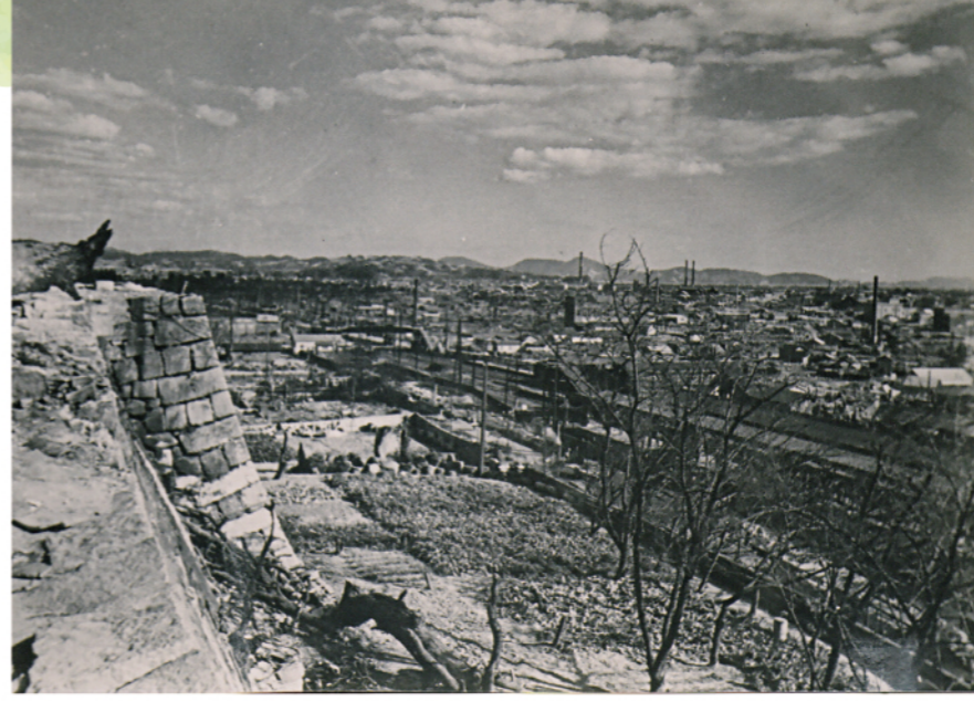
↑福山城から見た焼けた福山の市街地(1946年坂本万七撮影)