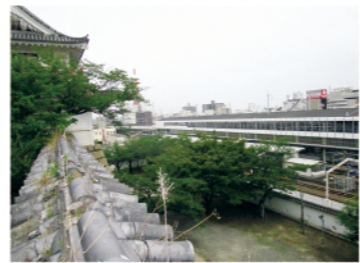
←同じ位置から見た現在の様子