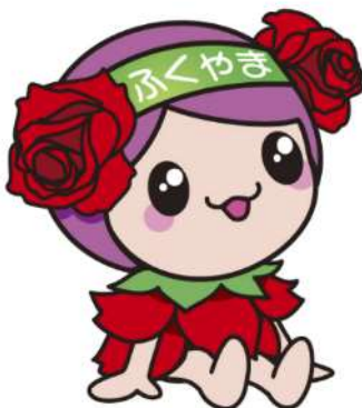
ばらのまち福山 イメージキャラクター「ローラ」