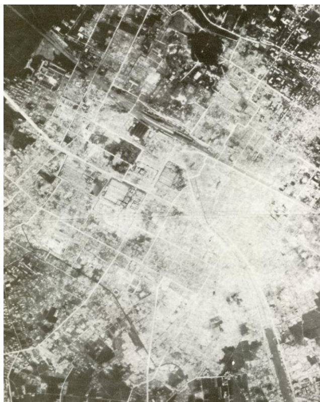
空襲により焼け野原となった福山市街中心部