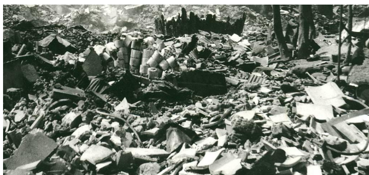
爆撃の被害にあった工場