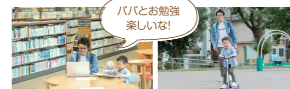
パパとお勉強 楽しいな!

子育てのバランスがママだけに偏っていませんか?家庭ではパパとママが協力して子育てをしましょう。