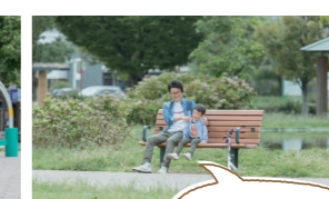
今日はパパと 一緒だね!

従業員への休暇取得やテレワークを活用した在宅勤務の促進など、子育て参加を推進するための取組を進めましょう。