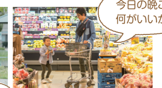
今日の晩ご飯 何がいいかな