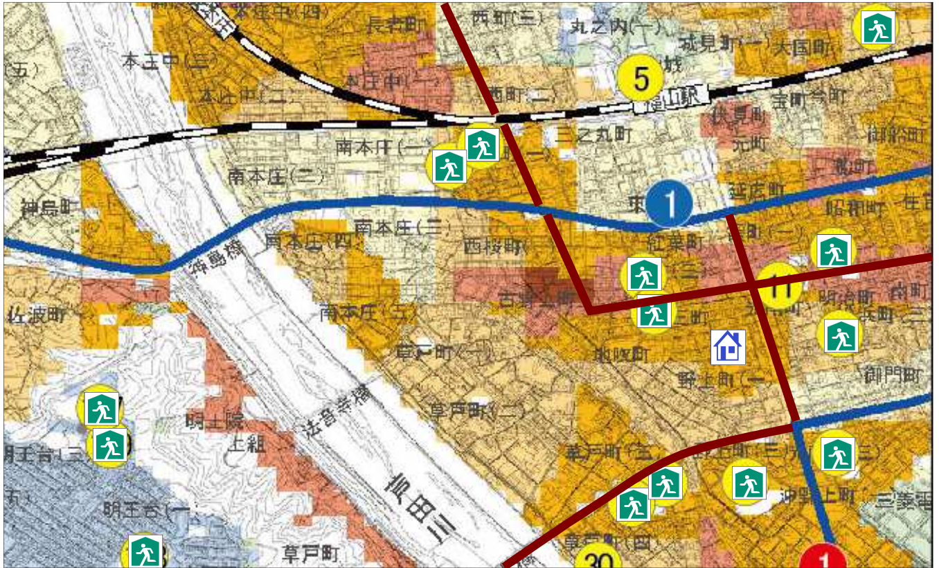
【地域防災マップの作成例】

地域の自治会（町内会）などで話し合い、もう一度「 防災の視点 」で地域を見直してみましょう。地域ならではの防災マップを作成して、防災対策に役立てましょう。