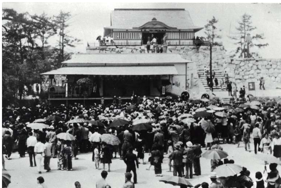
福山地方産業復興博覧会