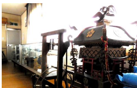
(民俗資料館“かかしの里”の様子)

この祭りの売上は、民俗資料館の運営費に充てられるということですが、地域のみなさんに