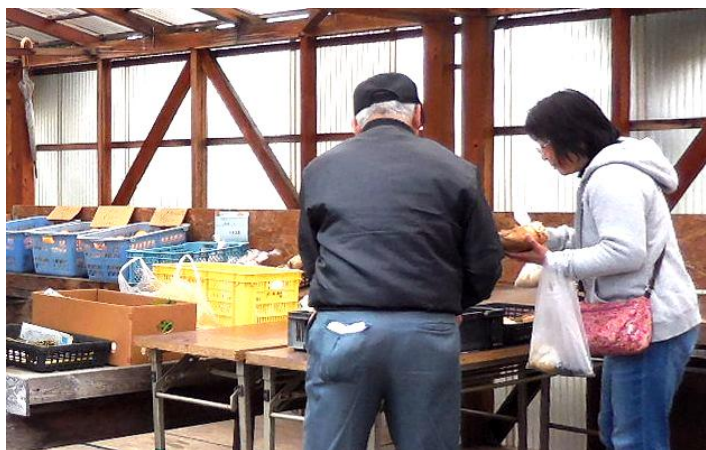
(かかしの里資料館祭りの様子)

当日はあいにくの天候でしたが、竹の子や新鮮野菜などを求めて学区内外からたくさんの方が来場されました。