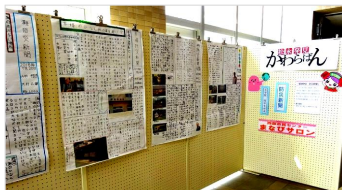
(松永発見かわらばんの様子)

この新聞は、柳津小学校の4年生(当時)が総合学習の時間に取組んだものです。自治会長など、地域の方からの聞き取りや、危険な場所の調査を行い、地域の防災について詳しく調べていました。