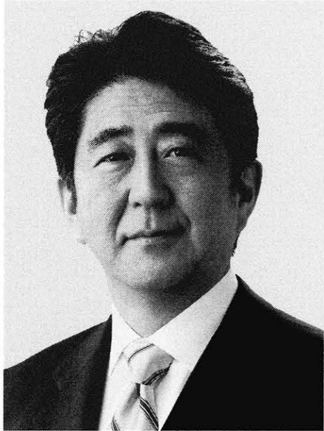
自由民主党総裁 安倍晋三