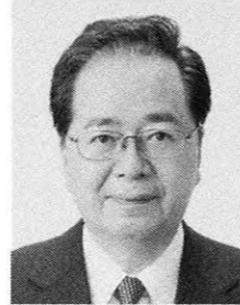
元環境大臣 党幹事長代行 前衆議院議員 さいとう 鉄夫