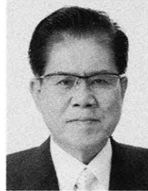
元厚生労働副大臣 党中央幹事 前衆議院議員 ますや 敬悟