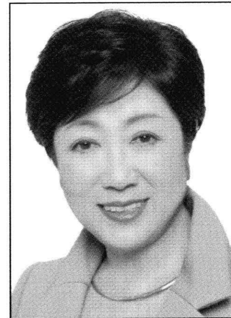
希望の党 代表 こいけ ゆりこ 小池 百合子