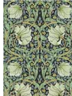
《ピンバーネル(るりはこべ)》1846年(印刷) ©Morris & Co.

ウィリアム・モリス(1834-1896)のデザインを中心とした壁紙の展覧会です。英国有数の壁紙会社、サンダーソンが所蔵する日本初公開の約130点の壁紙やモリスの版木などを通して、19世紀に興隆期を迎えた英国壁紙デザインの変遷をたどります。また、会場内にモリスデザインの壁紙を使った撮影スポットを設け、モリスが目指した「美しい暮らし」を体感していただけます。