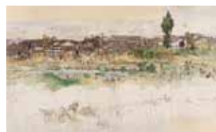
大村廣陽《風景・蓮池》1910年代

色彩豊かな花鳥動物画を描いたことで知られる福山出身の日本画家・大村廣陽（1891-1983）は、風景画も多く残しました。本展では、廣陽の風景描写を切り口に、诗情溢れる本画や瑞々しいスケッチの数々を展覧します。