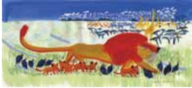
『ライオンのよいいちにち』 (2001年/佼成出版社) ©Hiroshi Abe

あべ弘士(1948-)は、動物園の飼育係という経歴をもつ絵本作家です。彼が勤務していたのは、日本を代表する動物園の一つ、旭川市旭山動物園。在職中の1989年、『雪の上のどうぶつえん - なぞの あしあとの まき-』で絵本の世界に登場し、1994年に手掛けた『あらしのよるに』(文:木村裕一)の挿絵は高い評価を受けました。そして、動物たちを主人公にした独特の世界を築き上げ30年、現在、日本を代表する絵本作家の一人となっています。本展は、作家自身の提案にも基づく、絵本、児童書の44タイトルの原画約240点などからその足跡を紹介いたします。