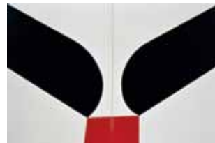
高橋秀《恍惚の瞬間》1986年

高橋 秀（1930-）は、福山市新市町出身の芸術家です。初期の抒情的な風景画は、1961年に安井賞を受賞するなど高く評価されますが、1963年にイタリアへ渡り、鮮やかな色彩の抽象作品へと伸展し、1990年代後期には、“新琳派”と称するスタイルを確立。今も変貌を続ける60年余の軌跡を展覧します。