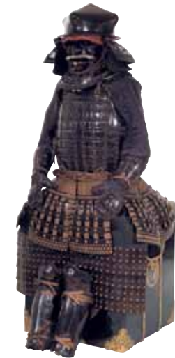
重要文化財《伊予札黒絲威胴丸具足(歯染具足)》久能山東照宮博物館蔵

静岡県中部の久能山に鎮座する久能山東照宮は、徳川家康の遺命により元和2年(1616)に創建された国内最古の東照宮です。本展では、同社に伝えた家康遺愛の刀剣や甲冑を筆頭に、晩年を過ごした駿府で家康が使用した手沢品、徳川歴代将軍による奉納刀や自筆の書画といった宝物の数々を、ふくやま美術館、ふくやま書道美術館、福山城博物館の3会場に分けてかつてない規模で展観し、武家文化の精髓をご堪能いただけます。