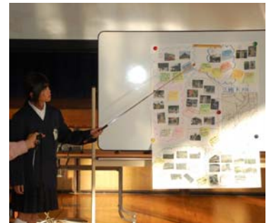
まとめたポイントを発表