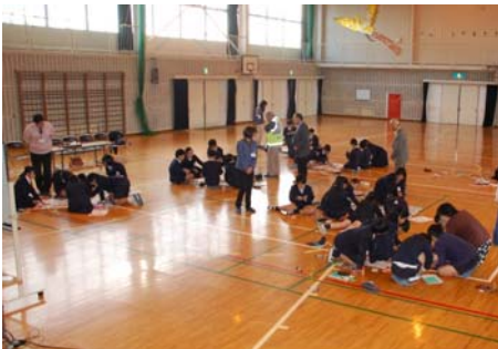
班ごとに話し合いながら、思い思いに取りまとめていきます。