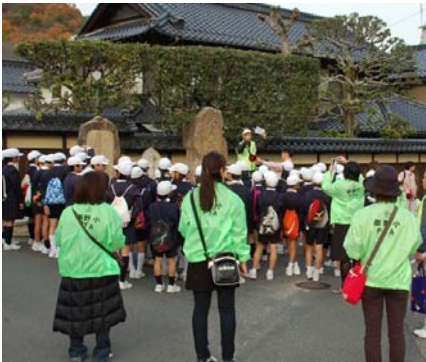
地域の方から郷土の歴史も学びました