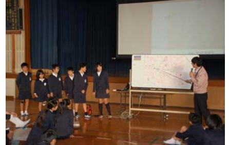
たくさん書き出した班の発表