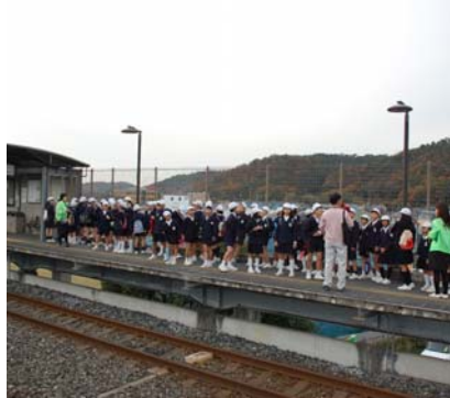
御領駅から御野のまちを見渡しました