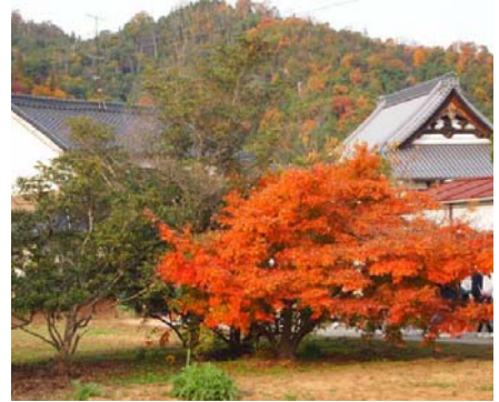
お気に入りの景観をパチッ！