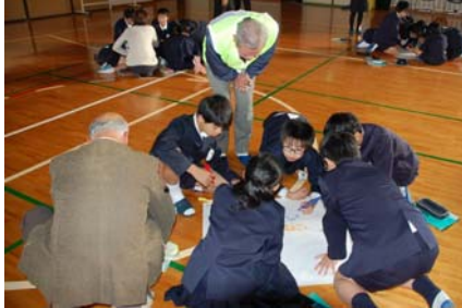
地域の方も参加してくれました