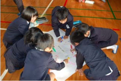
みんな、どんどん書いています

20分位の作業時間にもかかわらず、多い班では100個以上の言葉が生まれ、模造紙に収まりきれないくらいになりました。