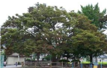
御野小学校のケヤキ