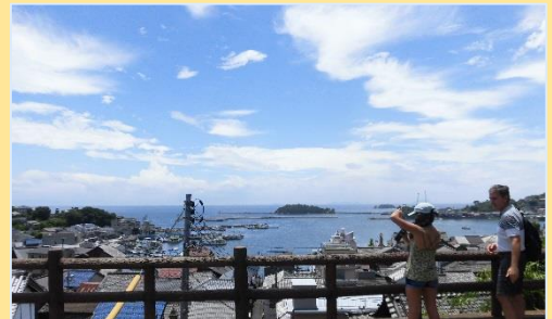
ふくやましものうられきしみんぞくしりょうかん 福山市鞆の浦歴史民俗資料館