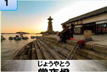
じょうやとう 常夜燈