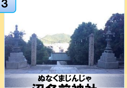
ぬなくまじんじゃ 沼名前神社