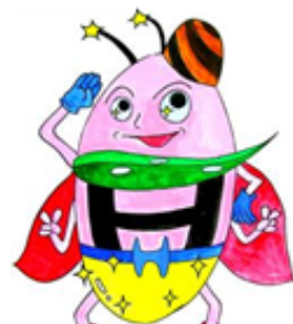
「ホタマン」 今津学区の ほたるキャラクター