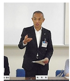
福山市教育長 三好 雅章

皆様の思いをしっかりと受け止め、教育が子どもたちの未来をつくるとの覚悟で、新しい学校づくりに全力で取り組んでまいります。