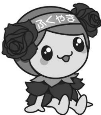
ばらのまち福山 イメージキャラクター「ローラ」