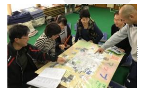
【防災カアップサークル】 地域防災マップの作成

【問合せ先】 福山市役所まちづくり推進部 人権・生涯学習課 TEL(084)928-1243 FAX(084)928-1229